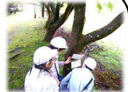
サーチ・ザ・ツリー

葛川少年自然の家に行き、アマゴつかみ、スプーン作り、サーチ・ザ・ツリーを行いました。子どもたちはそれぞれの活動に一生懸命、取り組んでいました。