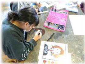
ものづくりクラブ