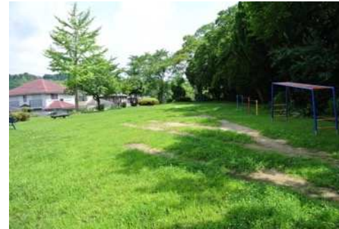
同公園剪定、公園灯増設