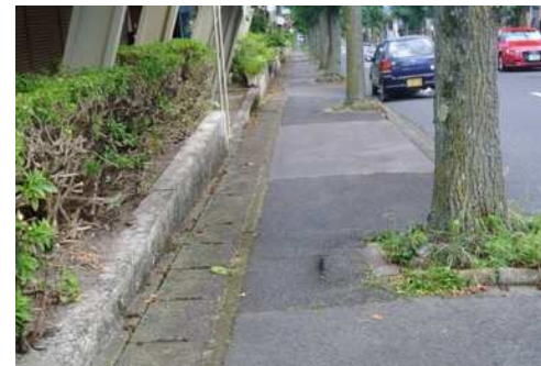
日吉台一丁目 20 滋賀銀 ATM 南