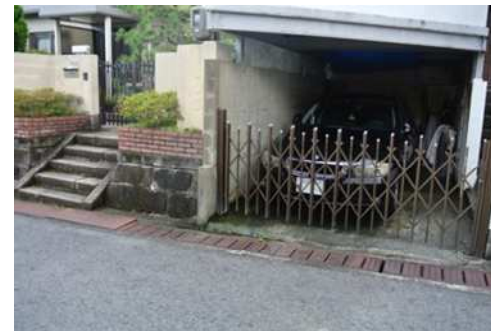
日吉台三丁目 16 番 地先 宅地