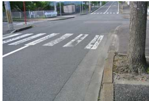
日吉台一丁目 20 地先