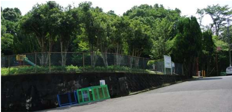
要望6 湖西道路樹木帯