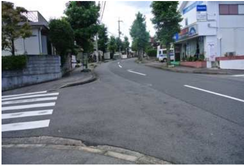
要望7 日吉台二丁目19番地先