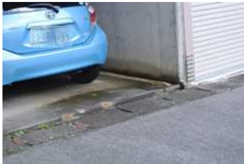
要望 3 日吉台四丁目 27-3 南側車庫 同宅地北側道路法面