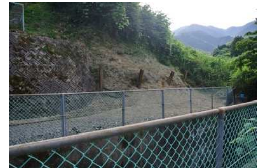
日吉台二丁目 37 番 高橋川沿い崖地