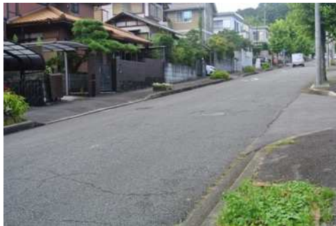
要望 2 日吉台四丁目 15 番地先