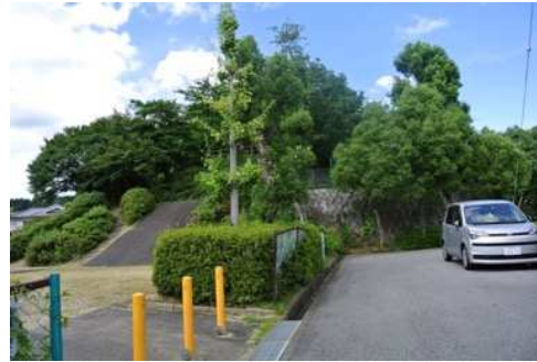
要望4 日吉台第3号公園