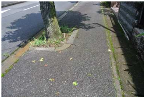
要望 1-1 日吉台一丁目 2-5 付近