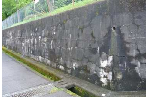
要望5 日吉台第9号公園 ひび割れ