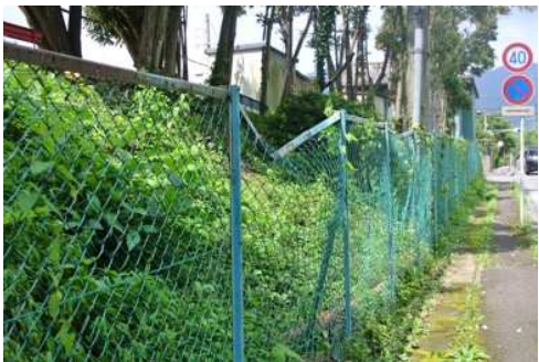
要望9 広場北側のフェンス