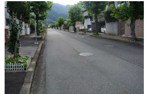
日吉台四丁目 27 番地先