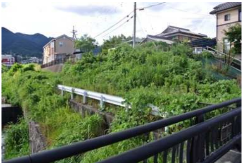
要望8 日吉台二丁目2番地先