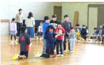
1年生へのインタビュー