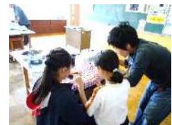
ミシン操作の補助

本年度は昨年実施したミシン操作の補助、九九の聞き手に加え、新たに校外学習の支援等をお願いする予定です。「ひよサポ」への登録や詳細については日吉台学区のホームページをご覧ください。