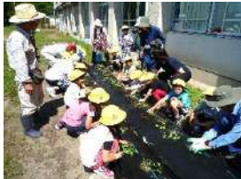
1年さつまいも苗植え