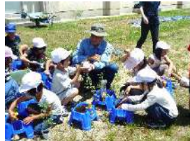
2年ミニトマト植え

ふれあい農園の方に教えていただき、1年生はさつまいもの苗を、2年生はミニトマトを植えました。収穫が楽しみです。