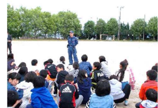
消防署員からの講話

担任の先生の指示に従って、すみやかに避難できました。火事や地震はいつ起こるかわかりません。万が一のとき、落ち着いて行動できるようにしましょう。防災言葉「おはしもち」、それぞれの文字から始まる言葉を言えますか？