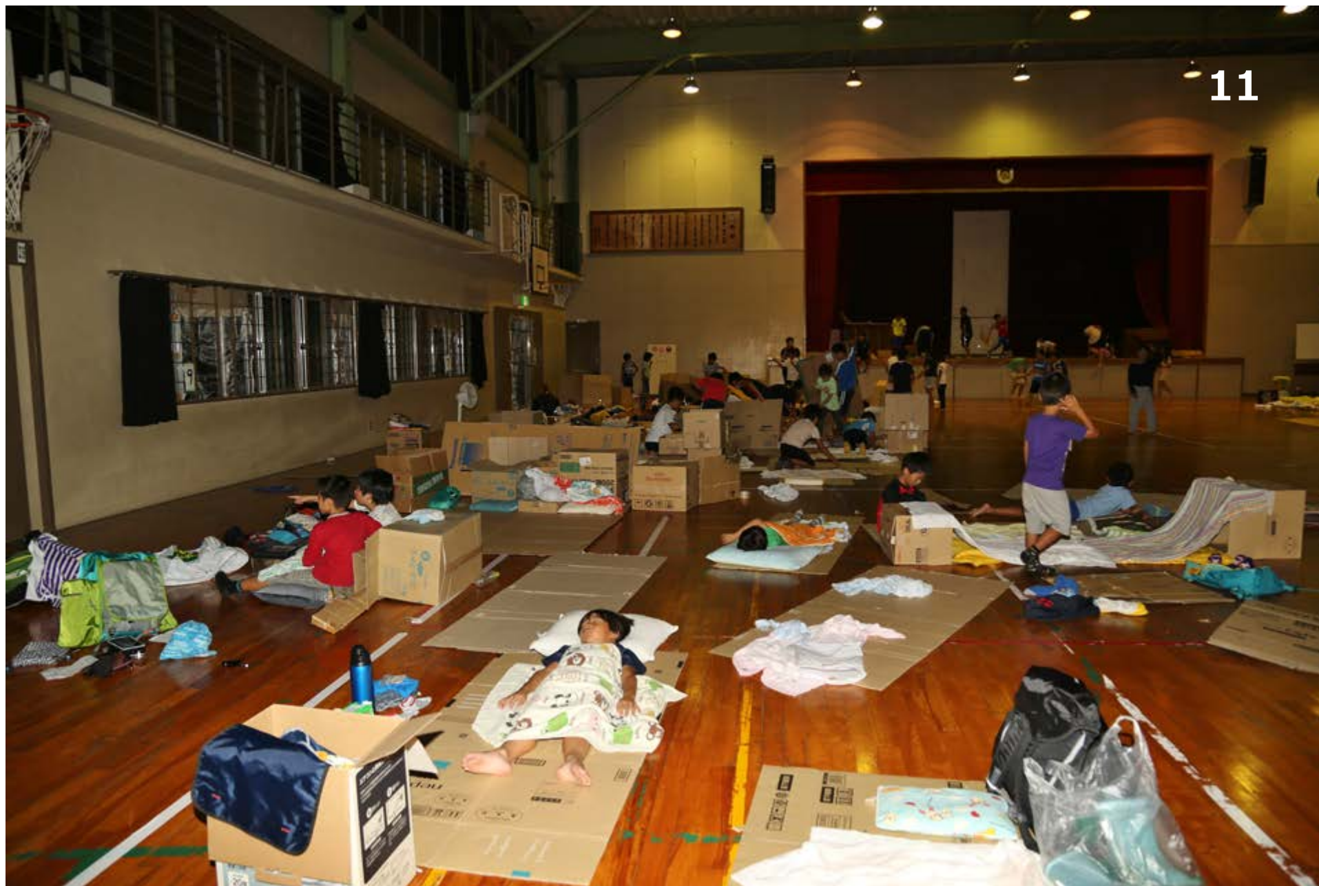
学校で泊まろう会(日吉台小体育館、8/1~2)