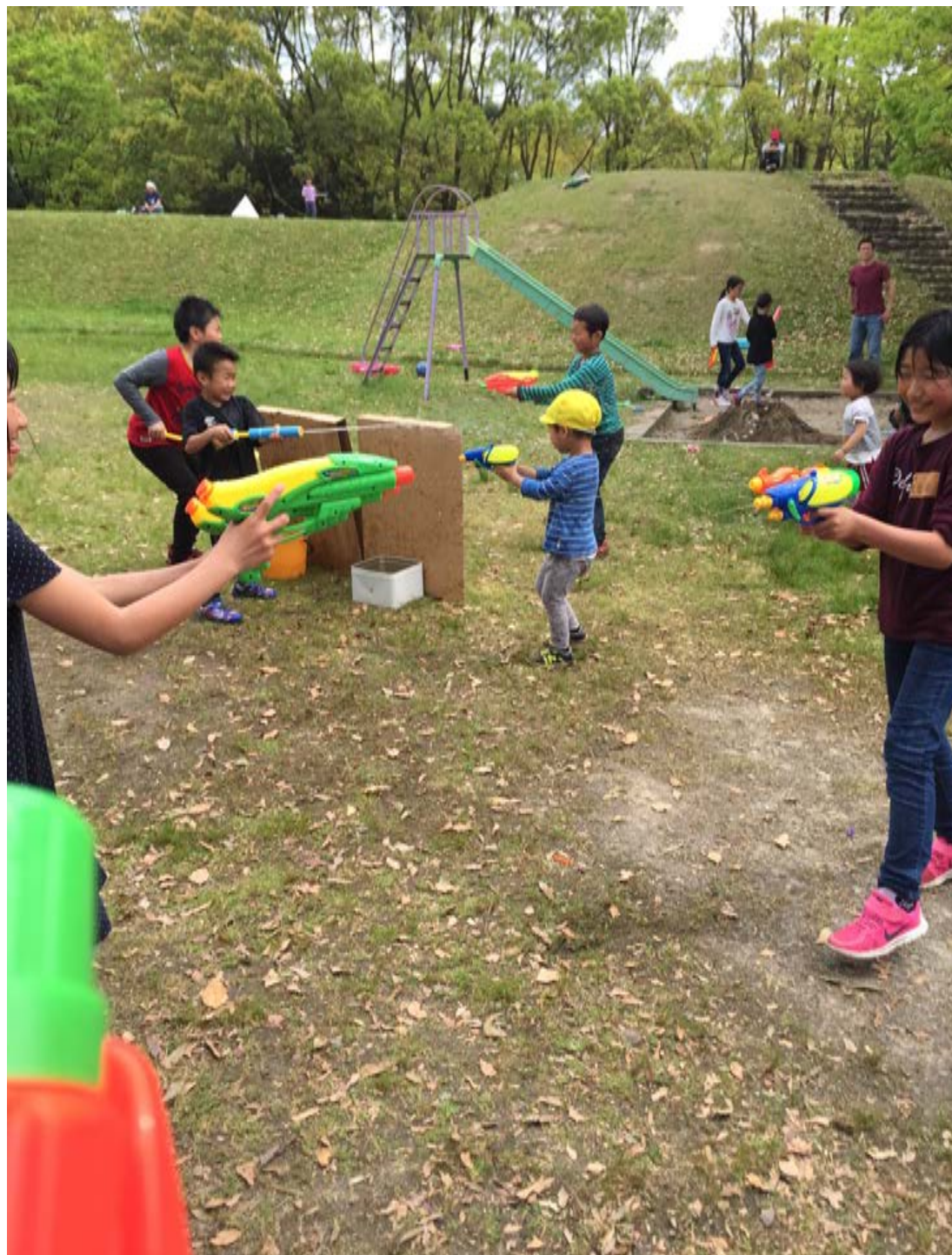
冒険アソ☆ビバ (古墳公園、5/1) 水鉄砲でサバイバルゲーム