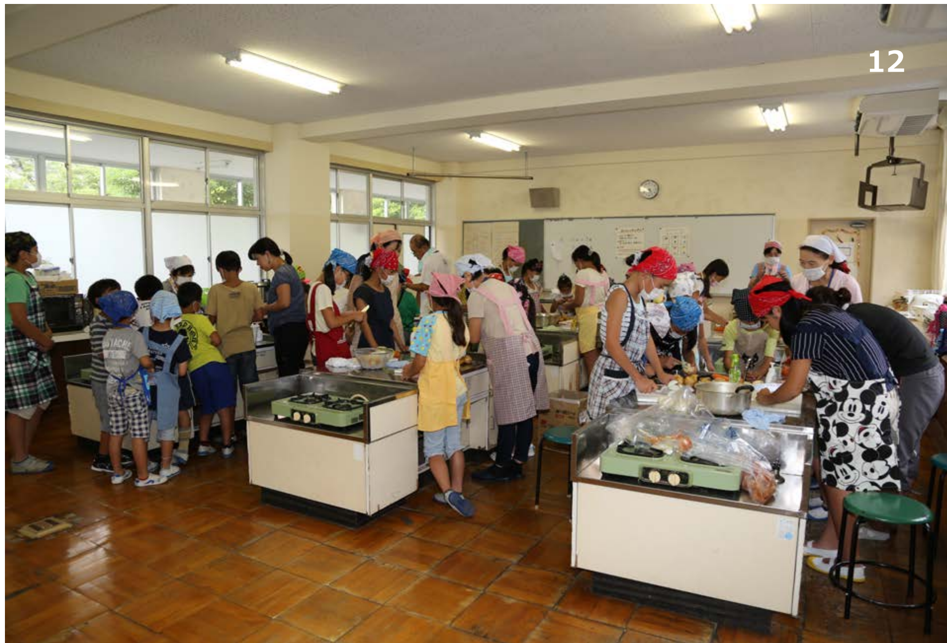
学校で泊まろう会(カレーづくり)