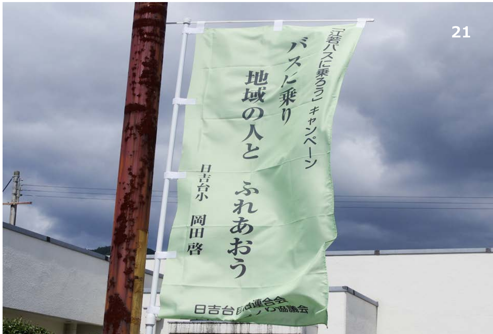
のぼり(市民センター前)