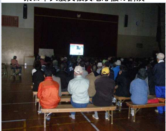
東日本大震災被災地応援の講演